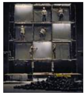
La Cie Amoros samedi à Kingersheim.

Samedi 8 janvier : Bluescorners (blues), Mulhouse le Greffier 21 h 30 ; Des vœux du maire pas comme les autres à Kingersheim, avec spectacle « Page Blanche » de la compagnie Amoros sur le parvis Tival à 19 h + Iskra (jazz manouche) à 20 h 45 à l'espace Tival + la Fanfare en Pétard (hip-hop ragga jazz dub) au Créa à 20 h 45 + Philos (chanson) aux Sheds à 20 h 45 + Hector Hayala et son trio à la maison de la citoyenneté à 20 h 45 + Last Minute band (hip-hop) au Créa à 21 h 45 + Jersers (chanson) aux Sheds à 22 h (tout gratuit) ; Radio MNE, 72 heures en direct non stop à Mulhouse, depuis la bibliothèque des Coteaux à partir de 13 h, depuis le café Rey à partir de 17 h 30 et depuis la discothèque l'Insonnia à partir de 1 h (infos et direct sur www.radiomne.com ) ; Misterobert (rock satirico-déjanté), Brunstatt au Chanfrein 21 h 30 (écoute sur www.myspace.com/misterobert ) ; Mojo (blues) + Second Hand (zydeco), Ensisheim le Caf'Conc 22 h ; Ulrich Althaus quartet (jazz), Saint-Louis foyer St Charles 20 h ; Marc Lavoine (chanson), Strasbourg palais des congrès 20 h ; 69DB + Crystal Distortion + Dra-