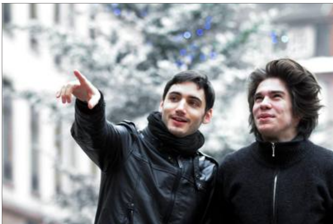
Le réalisateur alsacien Romain Cogitore et le comédien François Civil, hier, à Strasbourg.

En l'écoutant, Romain Cogitore change de projet, part sur une fiction. « Ce qui m'a intéressé dans son récit, c'est le côté contemporain, la proximité avec cette jeunesse. Ceux que l'on voit aujourd'hui comme des héros, des jeunes qui vou-