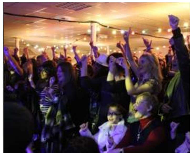
Environ 1500 personnes se sont déplacées pour assister à ces vœux hors normes.