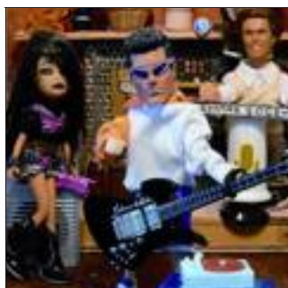
Cabaret pop.

■ SE RENSEIGNER ET RÉSERVER au 03.89.50.68.50.