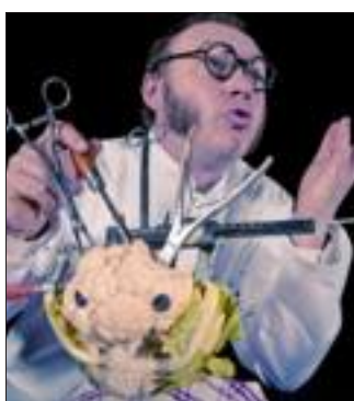
Le Polichineur ne recule devant aucun sacrifice.