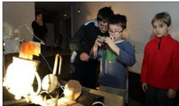
Après la visite, on expérimente. Première étape : photographier le sujet.