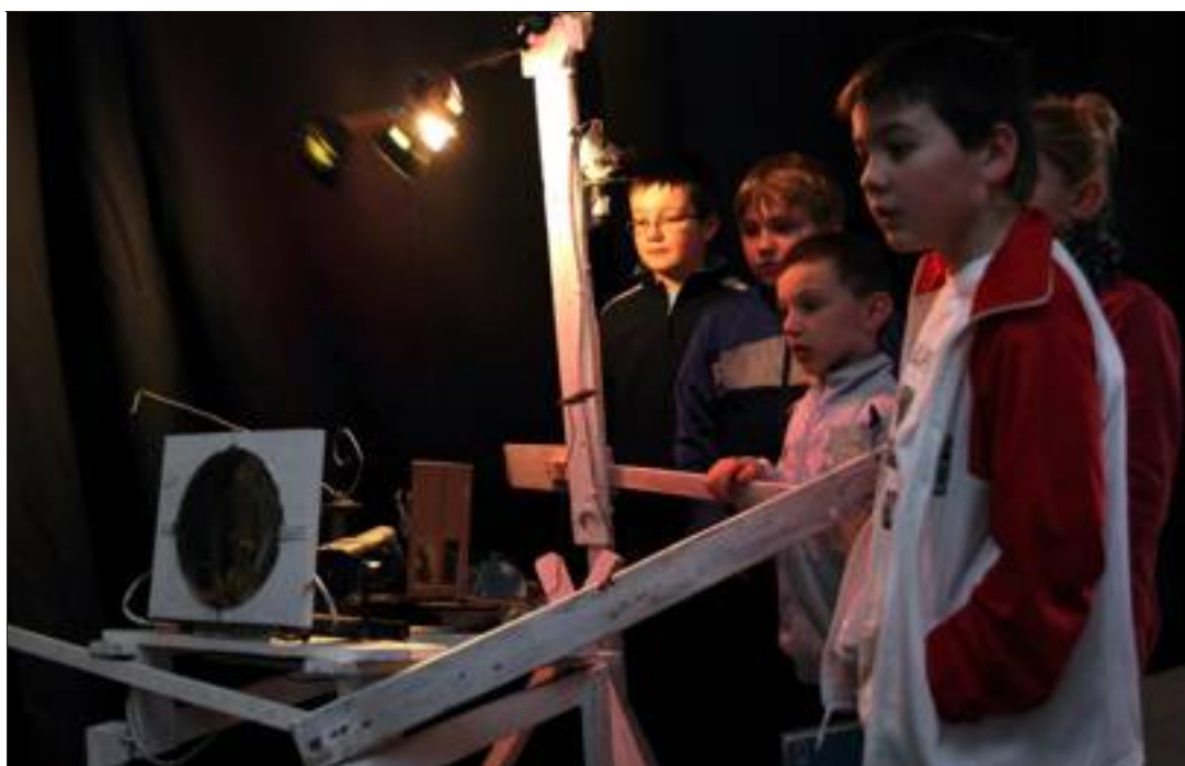
Les enfants peuvent à la fois découvrir les effets magiques de ces machines à fabriquer des images et observer leur mécanisme.