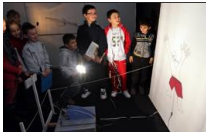
Voici un plongeur qui perd régulièrement son maillot...