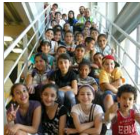
C'est la classe d'initiation de l'école élémentaire Thérèse qui a remporté le prix du public du festival « Grain de sable ». F.M.