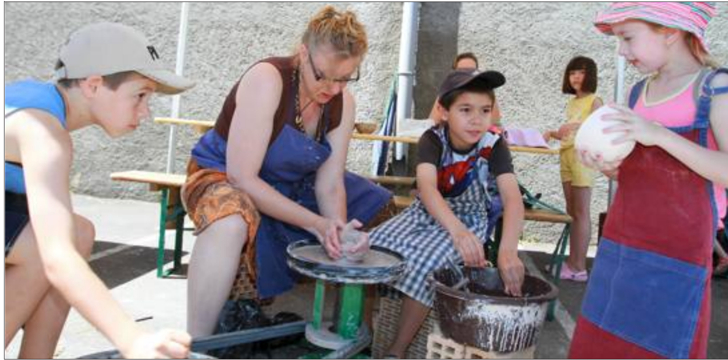
Mettre les mains à la pâte pour devenir un écocitoyen. Et plus on commence jeune, mieux c'est !