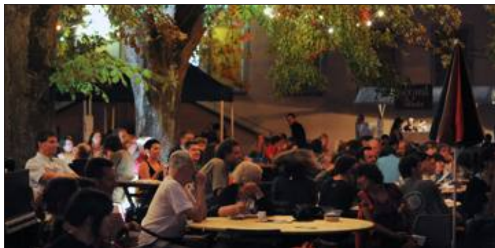
Samedi soir sous les tilleuls, place à la convivialité et à la musique avec les Zazous de Zoé et le groupe Karpatt, entre jazz manouche et rock.