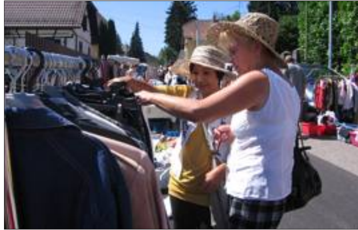
On a beaucoup chiné, hier, dans les rues de Bruebach, grâce aux 230 vendeurs installés.